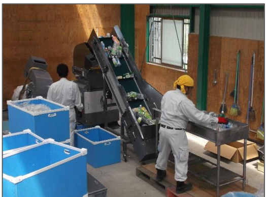
異物分別／除去→投入作業