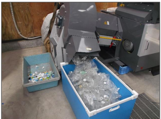
良品ペットボトル排出状況