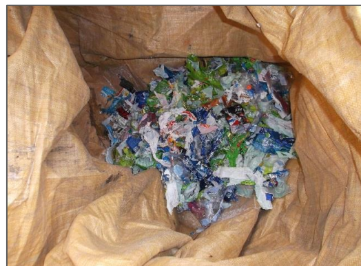
分離ラベル排出状況