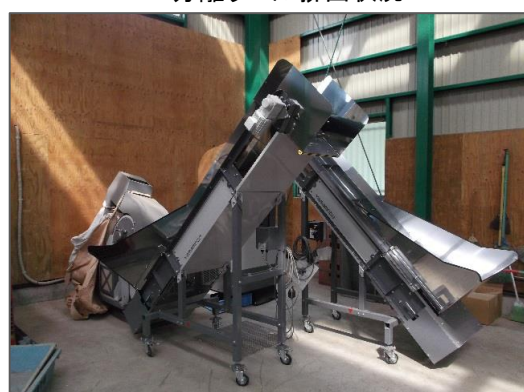
ホッパ付ベルコンRE-BC400 増設風景