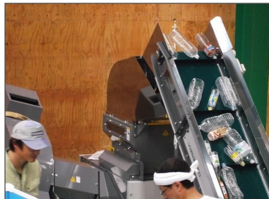
ベルトコンベア→本体供給状況