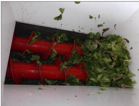
2軸スクレーで千切り/潰して→排出